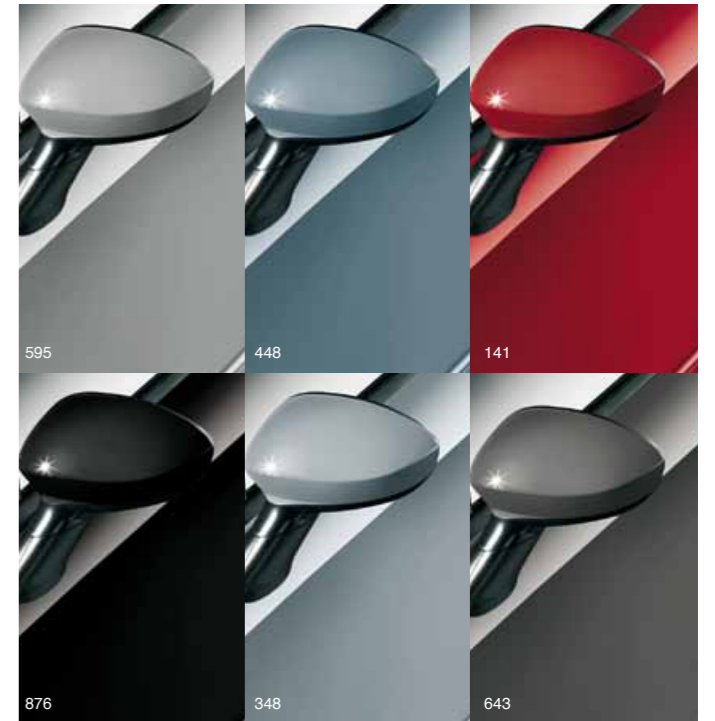
595 Chemical harmaa