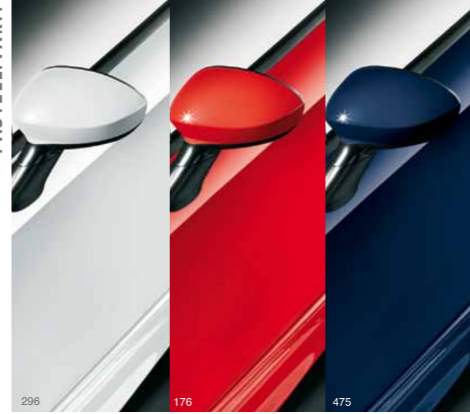
296 Ambient valkoinen